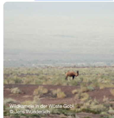
Wildkamele in der Wüste Gobi

Kann mit Ihrer Hilfe Weltnaturerbe werden: Die mongolischen Wüsten Große und Kleine Gobi sind aufgrund ihrer Ausdehnung, Vielfalt und Unberührtheit weltweit einzigartig. Sie beherbergen seltene Pflanzen- und Tierarten – darunter die letzten Populationen der Wildkamele, sowie des einzigartigen Gobibären. Die größten Populationen der Asiatischen Wildesel kommen hier vor, ebenso Schneeleoparden, Luchse und wiederausgewilderte Takhis (Wildpferde).