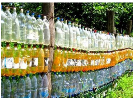
2-расм. Пластик идиши панжара.