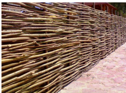
1-расм. Тўқилган панжара.