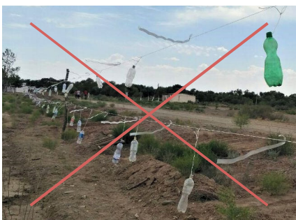
4-расм. Буғуға қарши панжара.

фаол даврида, сутканинг тунги пайтида далаларни қўриқлашади (тунги қоровуллар) ва бу буғуларни далаларга чиқишлари сонини аҳамиятли қисқартиради.