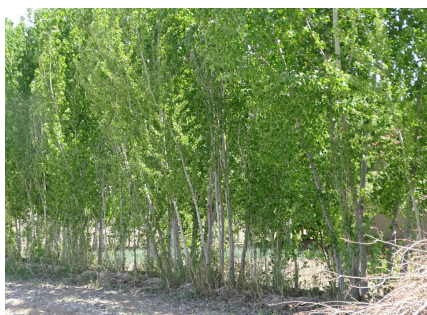
3-расм. “Жонли” тўсиқ.