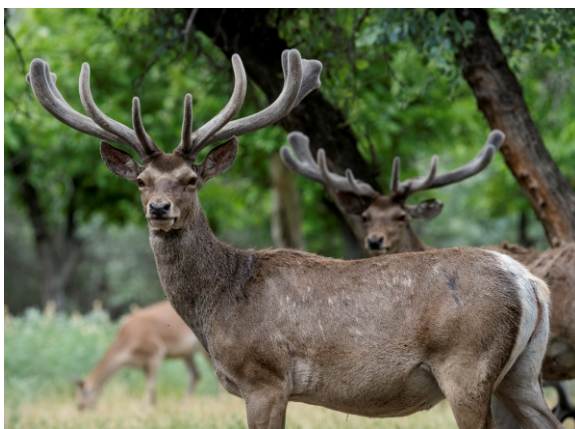
Рога в период роста мягкие и сверху покрыты бархатистой кожей. Такие молодые рога называют пантами.

В Нижне-Амударьинском биорезервате бухарский олень реакклиматизирован. В настоящее время здесь обитает более 1 200 особей, и поэтому это место является хранителем самой большой в мире популяции бухарского оленя.